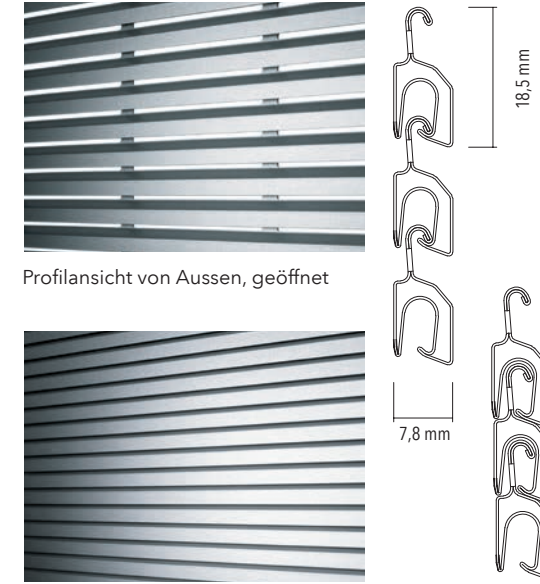
Profilansicht von Aussen, geschlossen,