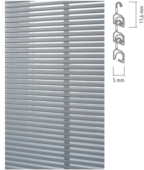
Profilansicht von Aussen