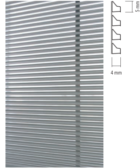
Profilansicht von Aussen