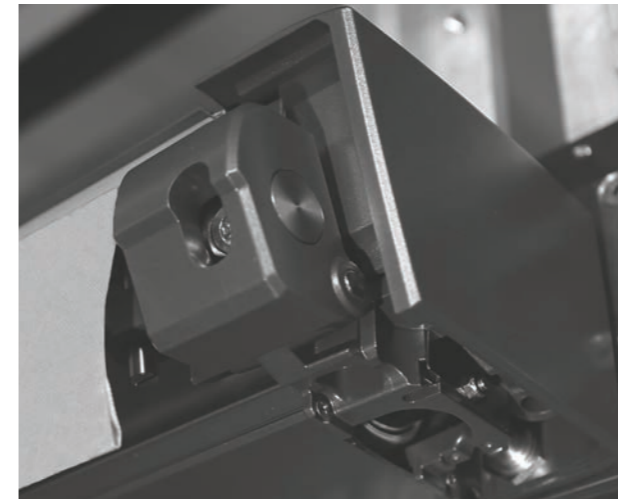
Erstklassige Produkte fortschrittlich gefertigt

Die besonderen Qualitäten und Eigenschaften unserer Produkte bestehen jeden Alltagstest.